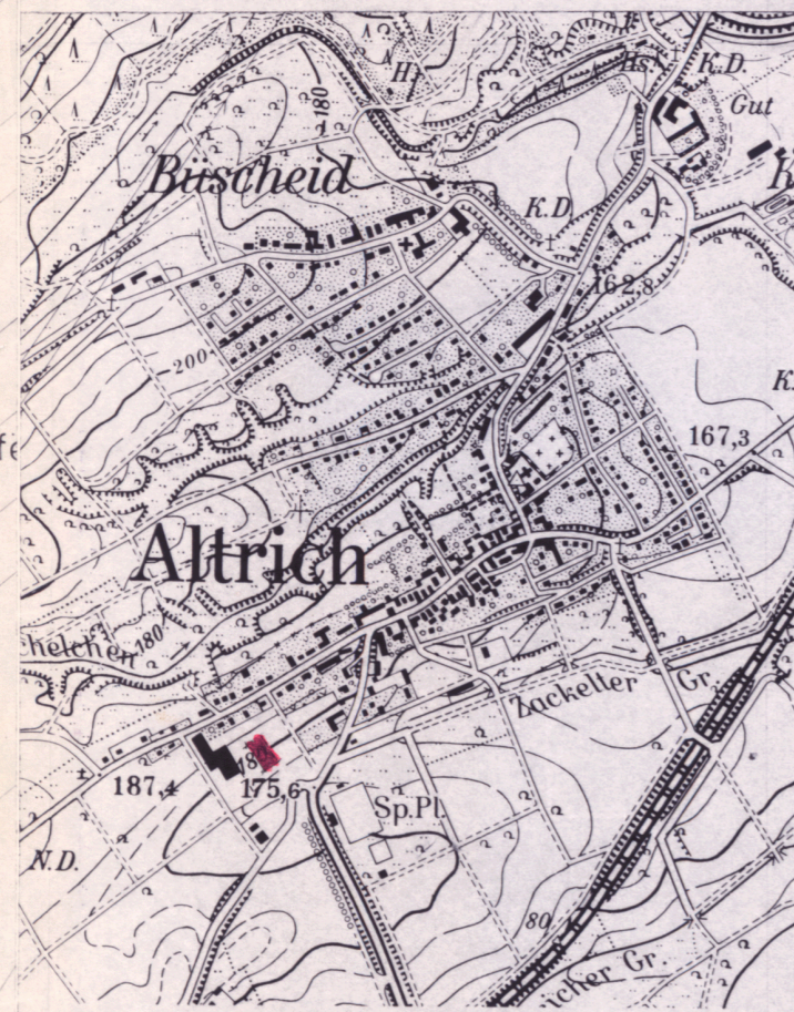
Vergrößerung aus der Top. Karte 1:25000